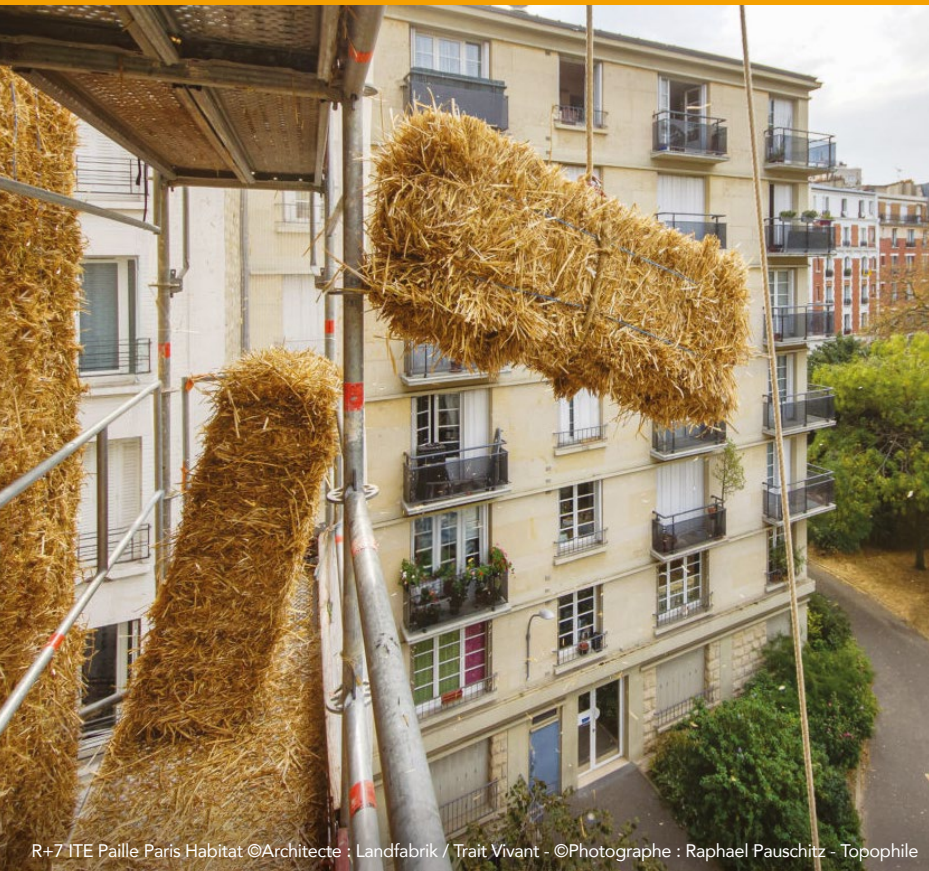
R+7 ITE Paille Paris Habitat ©Architecte : Landfabrik / Trait Vivant - ©Photographe : Raphael Pauschitz - Topophile

PARIS ————— Cité des sciences et de l'industrie 23 > 25 JANV. 2025