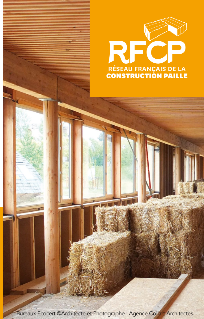
Bureaux Ecocert ©Architecte et Photographe : Agence Collart Architectes

PARIS ————— Cité des sciences et de l'industrie 23 > 25 JANV. 2025