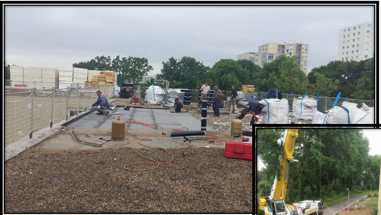
Dépose de l'ancienne étanchéité