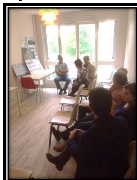
Réunion – 5 TAGE