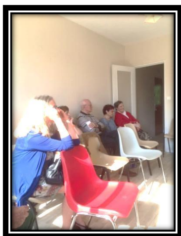
Réunion – 11 TAGE