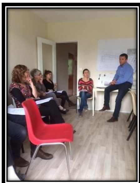
Réunion – 3 TAGE