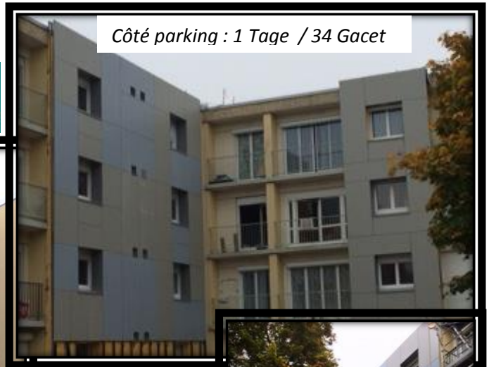
Côté parking : 1 Tage / 34 Gacet