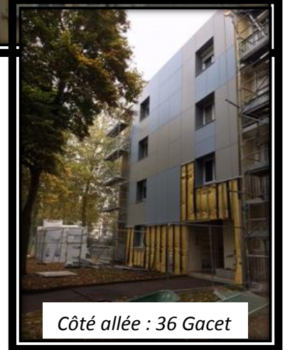
Côté allée : 36 Gacet

☞ Les garde-corps «façade allée» sont posés