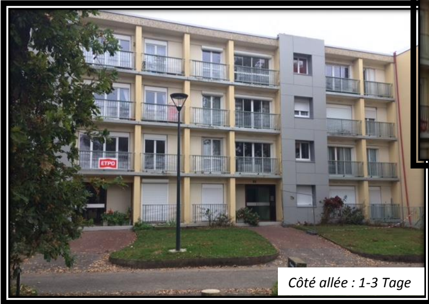
Côté allée : 1-3 Tage