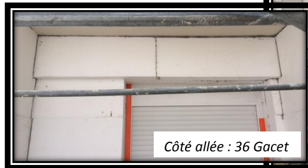
Côté allée : 36 Gacet